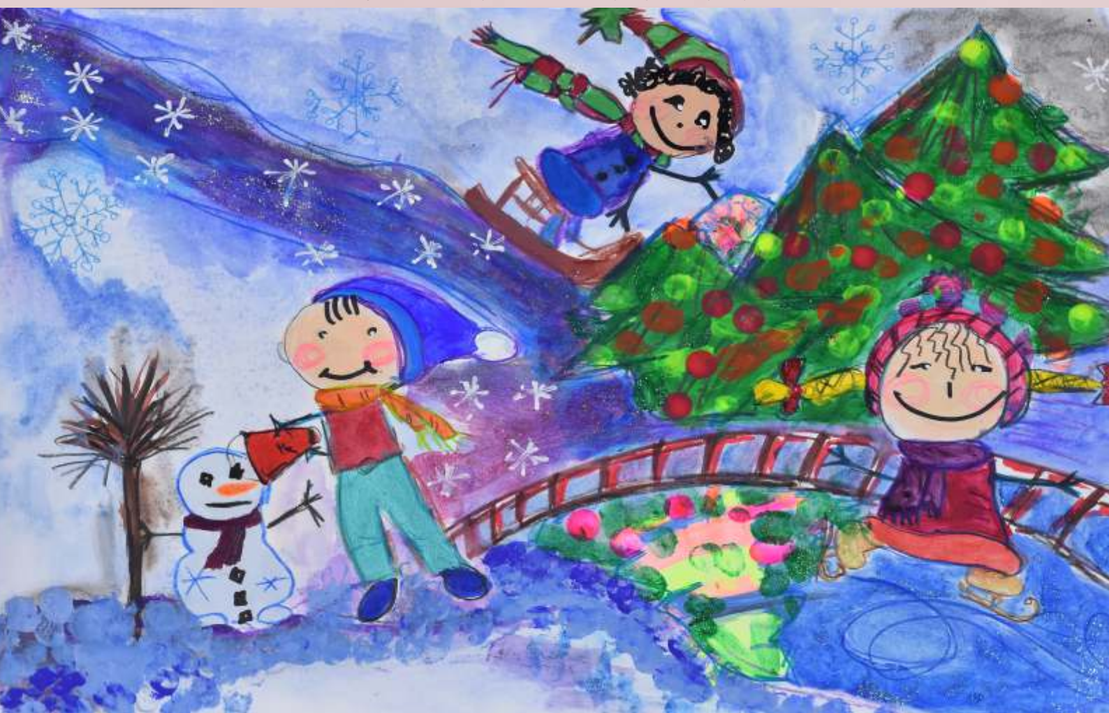
Milena Wąsek - wyróżnienie w Powiatowym Konkursie Plastycznym Cztery Pory Roku Oczami Dziecka