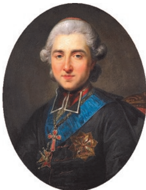
Michał Jerzy Poniatowski

nych opracowało kodeks szkolny, czyli zbiór przepisów pedagogicznych, organizacyjnych i administracyjnych nowego systemu szkolnego. Szkolnictwo elementarne czyli parafialne KEN uznawała za ogniwo edukacji w zakresie rozwijania oświaty i kultury wśród ludu. Efektem docelowym uznano wyprowadzenie warstw najuboższych z głębokiej ciemnoty i zacofania. Na zorganizowanie sieci szkół elementarnych KEN nie posiadała żadnych funduszy (na Litwie było lepiej). Za organizację szkoły parafialnej odpowiadał proboszcz przy częściowym, dobrowolnym wsparciu dziedzica. Proboszcz zachowywał prawo decyzji we wszystkich sprawach jego szkoły. Nadzór ze stro-