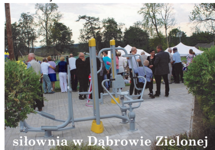
siłownia w Dąbrowie Zielonej

Zamontowano siłownie zewnętrzne w miejscowościach: Olbrachcice,