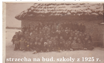
strzecha na bud. szkoły z 1925 r.

(wykręcający po związaniu snopeczków chował ruchomą deskę pod spód i blokował - mógł wtedy dokonać obrotu wiązki słomy o 180 stopni, a następnie wyciągnąć całą zespolony snopeczek do góry), 6. Otwór podpory. Wykręczone snopki były następnie przywiązywane do